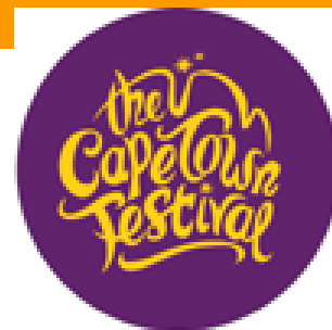
Night Vision dans Long street

La ville du Cap et ses rues, du 6 au 25 mars, ont vécu au rythme de son Festival. Trois semaines pour célébrer la diversité de la culture africaine et une occasion unique aussi d'assister à des réalisations internationales. Au programme : concerts, théâtres, poésie, projection de courts métrages, comédies musicales et animations dans les rues... Une excellente initiative dont la première édition s'est tenue en 1999. L'objectif, outre événementiel, de la part des organisateurs, est d'encourager la création culturelle aux retombées économiques importantes pour l'Afrique du Sud.